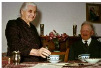
opa en oma van Weert